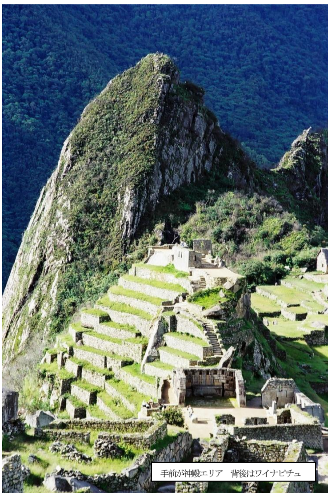
手前の神殿エリア 背後はワイナピチュ