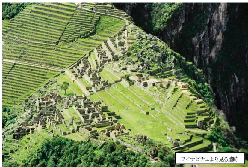
ワイナピチュより見る遺跡