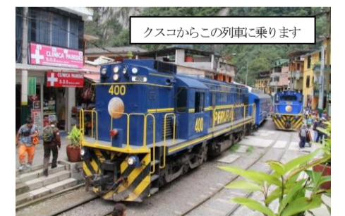
クスコからこの列車に乗ります

マチュ・ピチュの歴史保護区 Historic Sanctuary of Machu Picchu ペルー共和国 Republic of Peru 複合遺産 Mixed 1983年登録