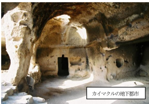
カイマクルの地下都市