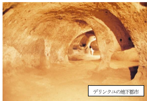
デリンクユの地下都市