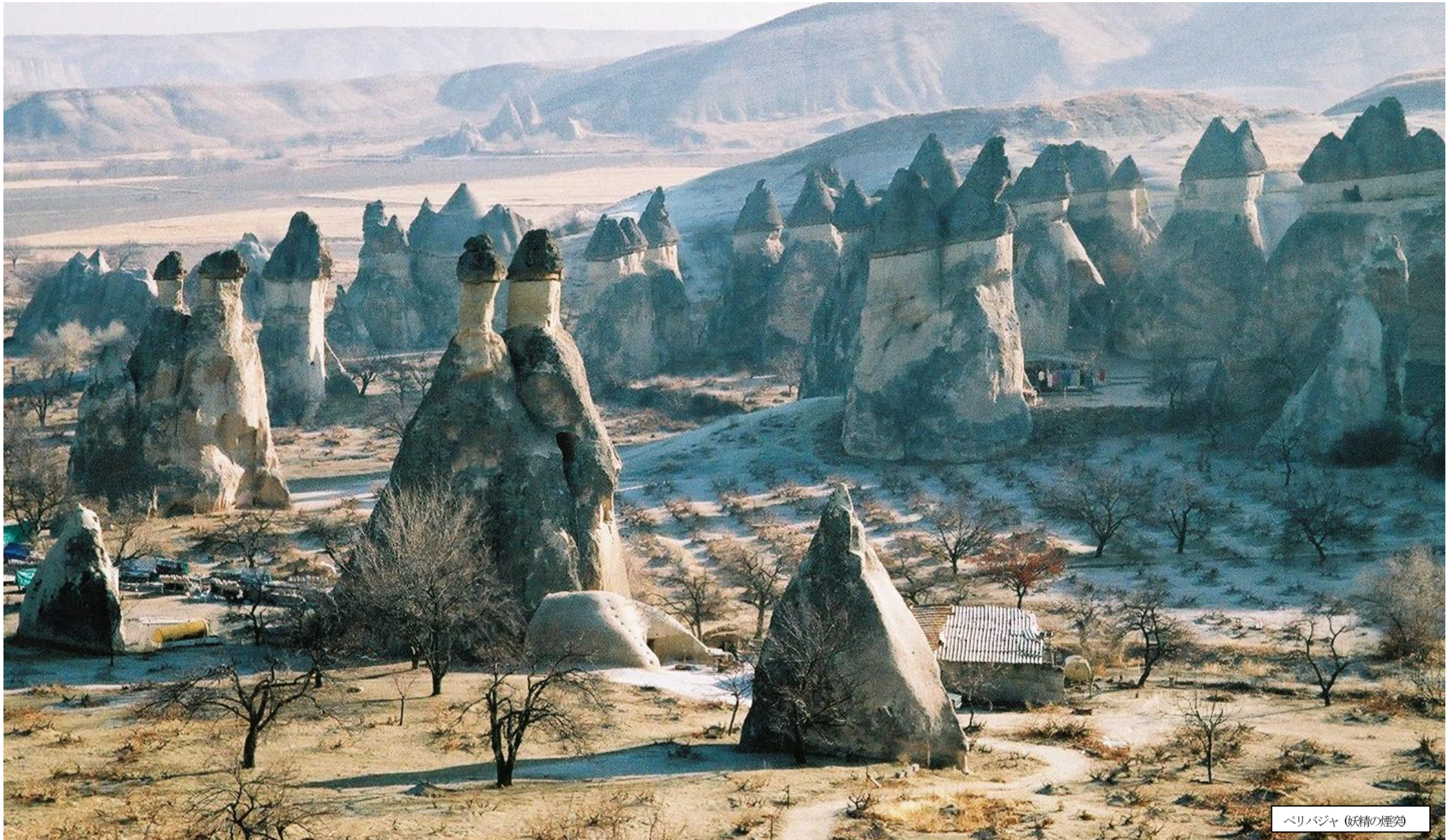
ペリバジヤ (妖精の煙突)