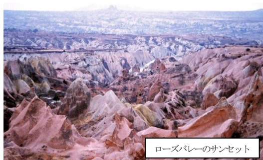
ローズバレーのサンセット