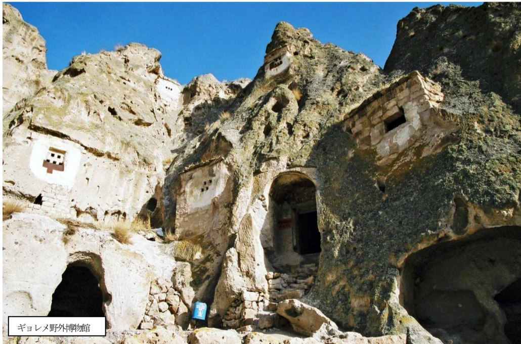
ギョレメ野外博物館