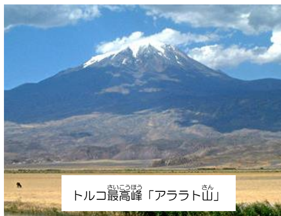
トルコ最高峰「アララト山」