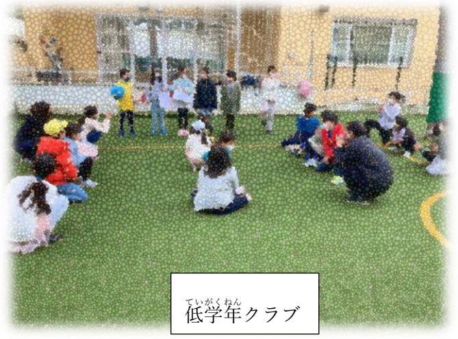
ていがくねん 低学年クラブ