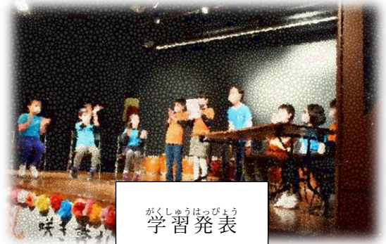
がくしゅうはっぴょう 学習発表