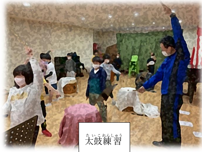
たいこれんしゅう 太鼓練習

ひだり わたし たんにん にほんじんがっ 左は私が担任している日本人学 こうしょうがくぶ ねんせい じかんわり なに 校小学部4年生の時間割です。何か き 気づきましたか？そうです！イスタ ンブルにほんじんがっこう すいようび きんようび ンブル日本人学校は水曜日と金曜日 いがいぜんこう じかんめ 以外全校が7時間目まであります！ これはちゅうがくぶとバスの時間を合わせ てるためなんです。たいへん すごいですね。その代 わりにげつようの「イスタンブルタイム」 はしょうがくぶの1から4年生が楽しくあそ ぶ時間になっています。国語や算数 などのがくしゅうの中身はにほんと変わ りません。「太鼓」という時間は、わだ こ れんしゅうをやる時間です。2月にあ るがくしゅうはっぴようかい ひろう る学習発表会で披露するために、 しゅういっかいれんしゅう 週一回練習しています。