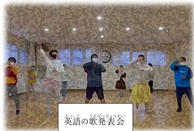
えいご うたはっぴようかい 英語の歌発表会

「低く」と書いてあるのは、「低学年クラブ」 のりやくです。みなさんがおこな っているようなクラ ぶ活動がないため、1～4年生がねんせい じゅんばん 順番にみんな であそぶ活動をかくごうしておこなっていま す。「英語タイム」はえいごのうたをうたったり、たんご テストをしたりしています。えいごのうたはねん 2回がいぜんこうの前で発表会をおこな っています。