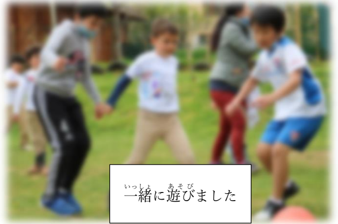
一緒に遊びました

つぎ おも ぎょうじ しょうかい 次は、主な行事を紹介します。イスタン ブル日本人学校は、トルコにあるということ にほんじんがっこう を生かして、げんち がっこう こうりゅうかい おこな ていまして、現地の学校との交流会を行っ ています。4月にユートピア校という学校の がっこう 発表会に参加しました。ユートピア校は幼稚 はっぴょうかい さんか 園部からちゅうぶ にかよ ほんのねんれい ちゅう 園部から中学部（日本の年齢だと中2）まで の子どもたちが通っています。言語も文化も げんご ぶんか 何もかも違いますが、コミュニケーションで なに ちが で大切なことは「心」だということがわ たいせつ ころ かりました。とても楽しい一日でした。