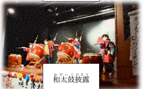
わだいのひろう 和太鼓披露

がつころ 2月頃に、「ボスポラス学習発表会」をおこな しょうごう じかん 2月頃に、「ボスポラス学習発表会」を行います。総合の時間などに がくしゅう ほごしゃ ほか がくねん む はっぴょう しょうがくぶ 学習してきたことを保護者や他の学年に向けて発表します。小学部の1・ ねんせい そうごう さくねん ど ひろう 2年生は総合がないので、昨年度は「トルコダンス」を披露しました。また、 わだいの ひろう はっぴょうかい がくねん ちから はい 和太鼓を披露するのもこの発表会です。どの学年の力が入ります！